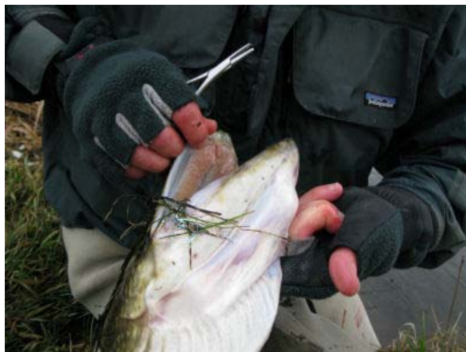
Foto: Gællebet. Anvendes til landing af gedden og håndtering ifm. afkrogning og genudsætning

Gællebet er noget af det, som mange har svært ved at lære. Til at starte med kan det også virke lidt grænseoverskridende, at stikke sine fingre ind under gællelåget og ind til de skarpe tænder. Men når det sidder på ryggen, så er det absolut den bedste måde at lande og håndtere gedder på. Man stikker pegefingern ind bag gællelåget, og fører den frem mod munden langs kanten på gællelåget. Man skal være sikker på, at man ikke har fået fat i gællerne, da disse er meget følsomme. Næsten helt oppe ved munden kommer der modstand, og det er her, at grebet skal sidde. Klem sammen omkring gællelåget, sådan at fisken ikke kan ruske sig fri, og man kan hurtigt mærke, om grebet sidder der, og om man har ordentlig fat i gedden. Gællebet gør det desuden nemt at få afkroget fisken, da gabet er åbent.