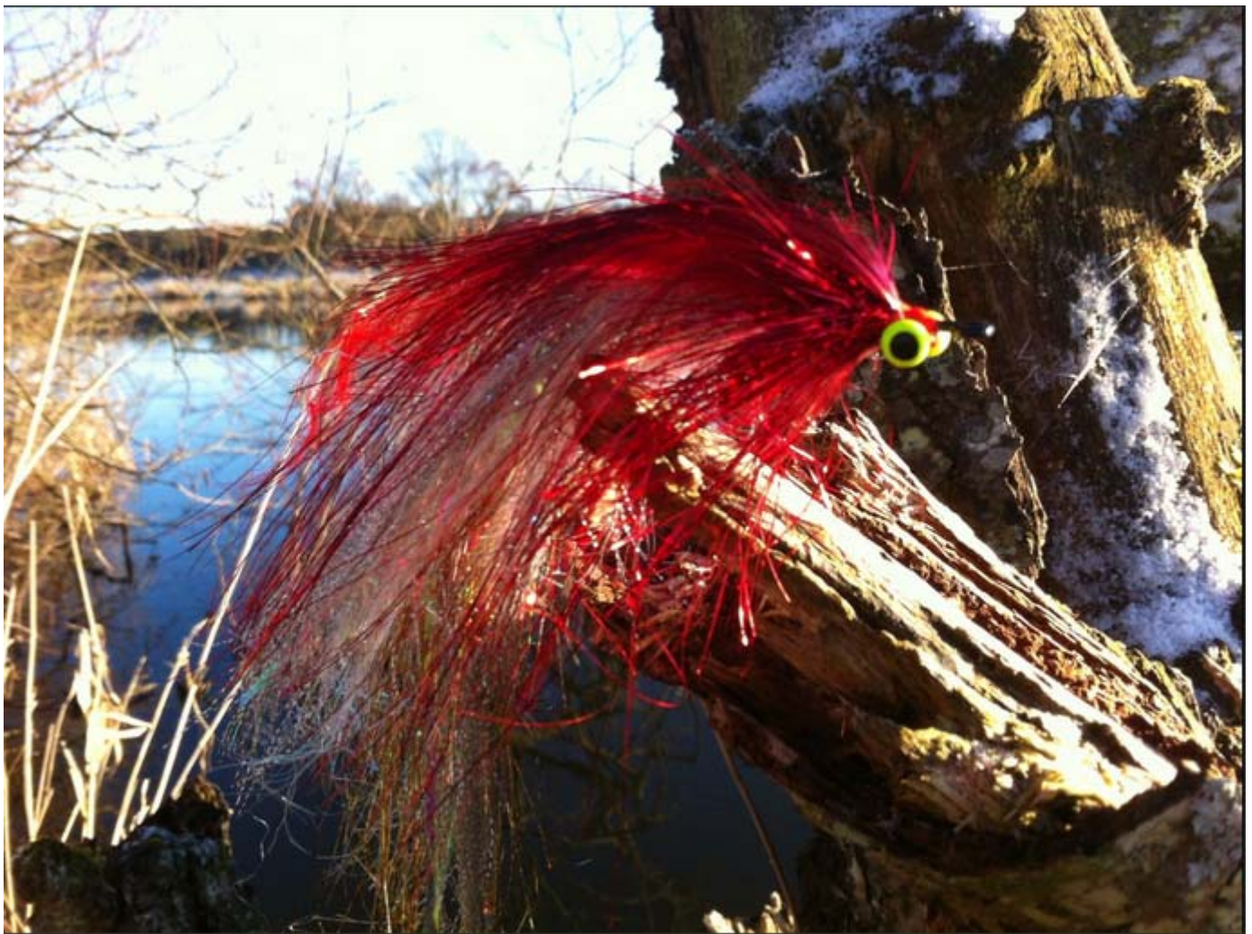
Eksempel på flash flue der anvendes til Geddefiskeri i Gudenå. Foto og flue: Casper Pedersen

Nyhedsbrev til lodsejere og medlemmer Februar 2017