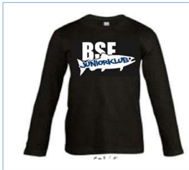
Trøje juniorklub BSF. Nb! – trykket er vist på forsiden, men kommer på ryggen.

For bestilling udfyld denne seddel og aflever i juniorklubben, eller send til juniorklub@bjerringbro-sportsfisker.dk