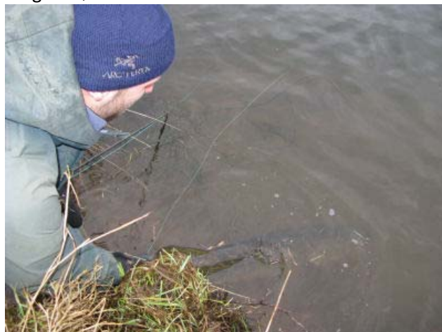
Foto: Genudsætning - sørg for at gedden får ilt inden den slippes - om nødvendigt trækkes den forsigtigt frem og tilbage for at der kommer ilt til gællern

I Tange Sø er der ikke forbud mod brug af agnfisk fanget i søen.