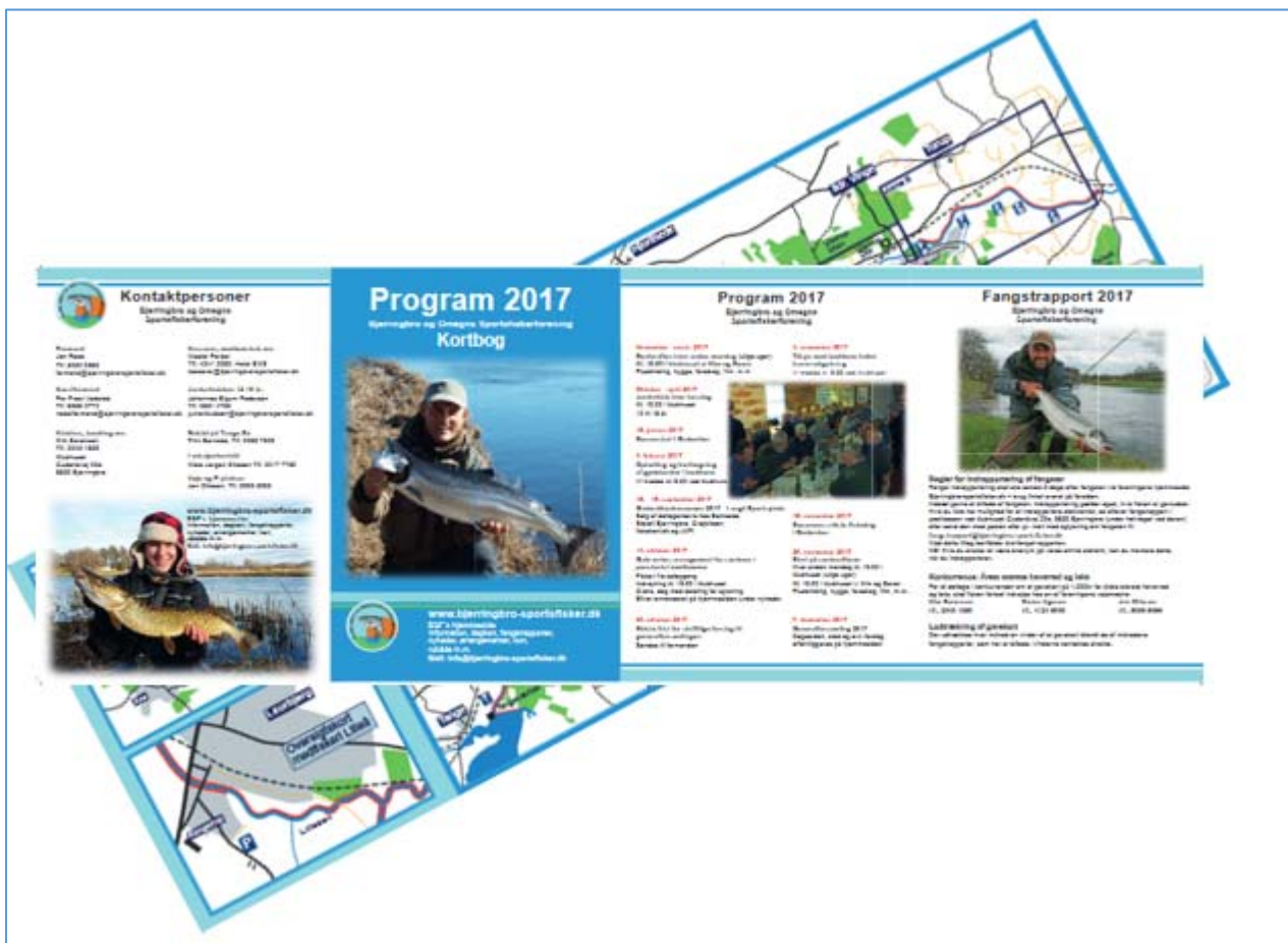
Program og Kortbog 2017

Program og kortbog 2017 er nu trykt og klar. Vi har i år kun trykt et begrænset oplag, der fx uddeles ved dagkort salg. Kortbogen udsendes ikke længere til medlemmer og lodsejere, der i stedet kan hente program & kortbog 2017 online på foreningens hjemmeside. Som noget nyt har vi i år både den