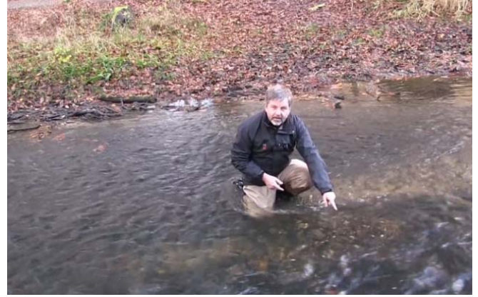
Foto: Fra DTU Aqua's lille film og spotning af brugte gydebanker

Brug to minutter til at se, hvordan havørredens gydeplads ser ud efter gydningen. Og nyd så naturen i et gydevandløb en dag i november eller december. Måske kan du være så heldig at opleve, at ørrederne gyder 😊