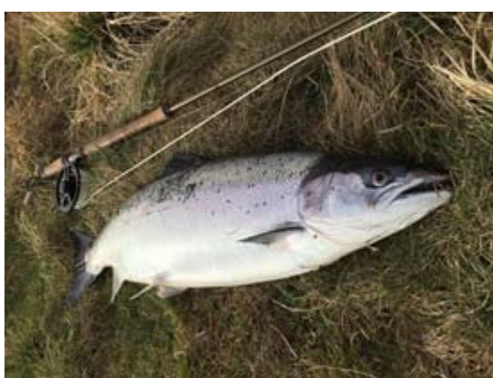
Carsten Lund, laks 6,7kg 84cm fanget 12. marts