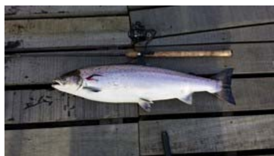
Laks 6,18kg 82 cm fanget af Jesper Møller 11. marts 2017