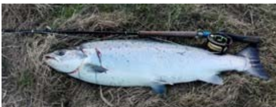
Laks 10,1kg 104cm fanget af Ole Kragholm 11.marts