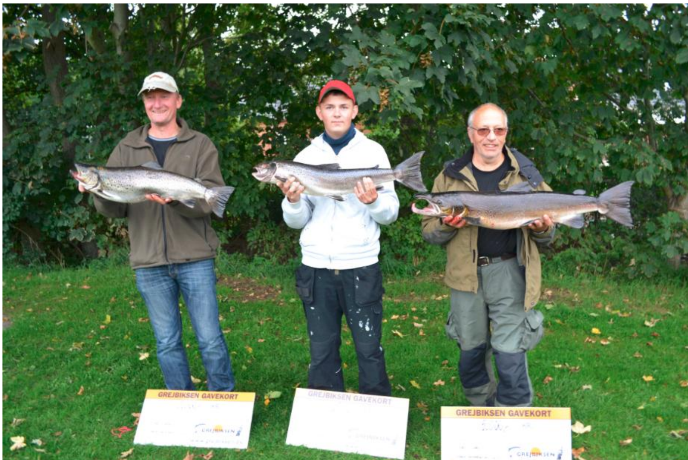
De glade vindere af hovedpræmierne i Gudnå konkurrencen 2015 med største havørred, laks og største juniorfisk.

Den høje vandstand kunne dog ikke holde lystfiskerne fra at hale ganske mange fine fisk på land. I alt 35 laks, 24 havørreder og 2 gedder blev fanget, hvilket er væsentligt bedre end sidste år.