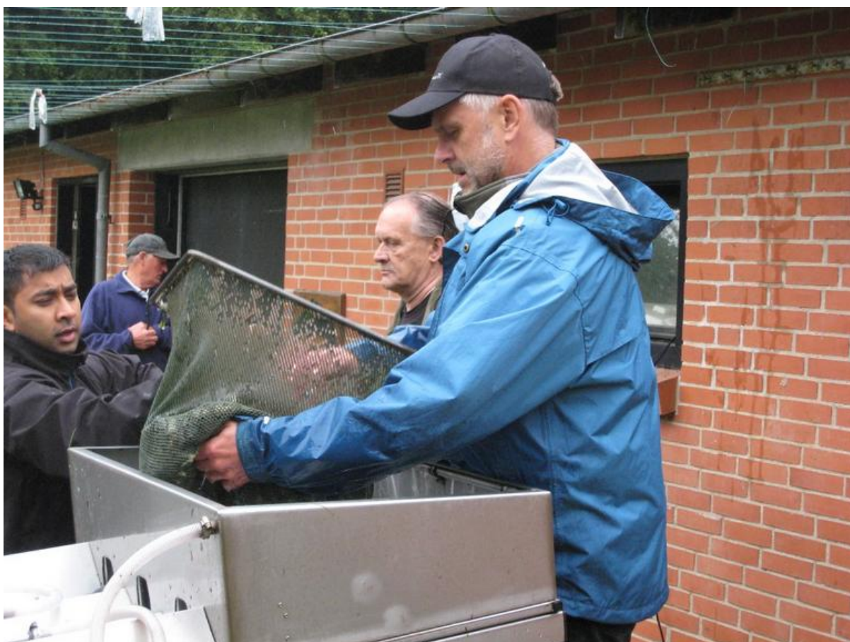
Foto: Sortering af fisk hvor arbejdsholdet hjælper pasningsordningen

Hilsen Per Frost Vedsted Naestformand@bjerringbro-sportsfisker.dk