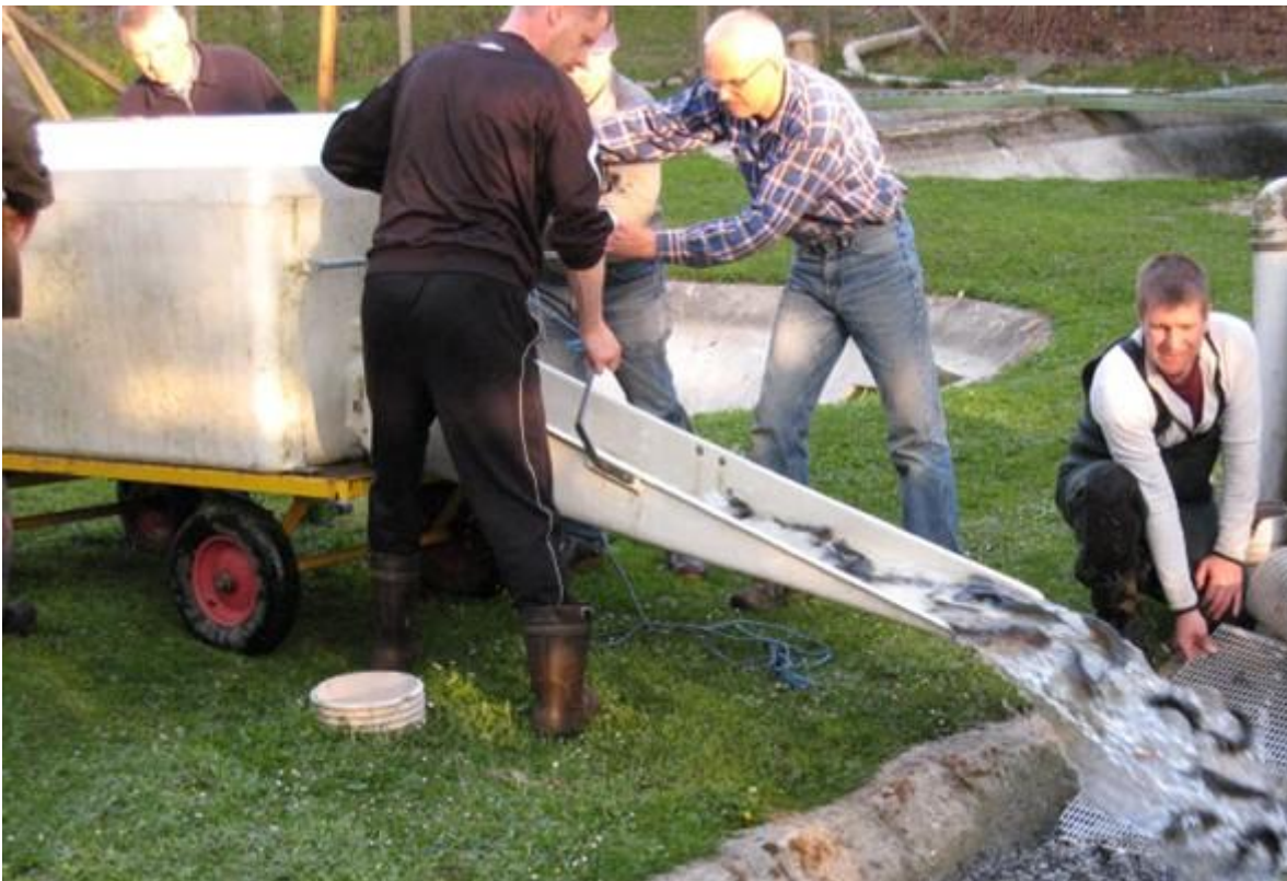
Foto: Pansningsordning får hjælp af arbejdsholdet ifm. Sortering og flytning af fisk på dambruget i Skibelund.